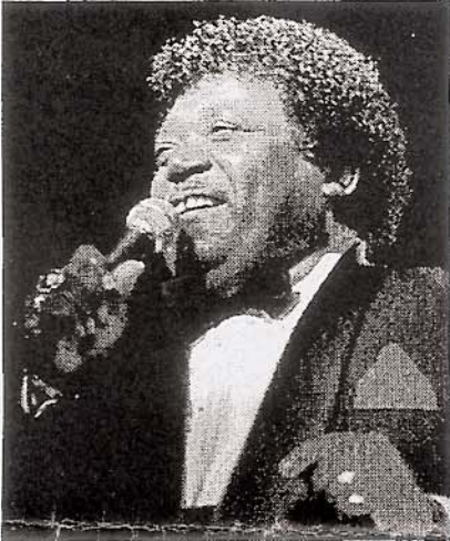
Sänger Percy Sledge.