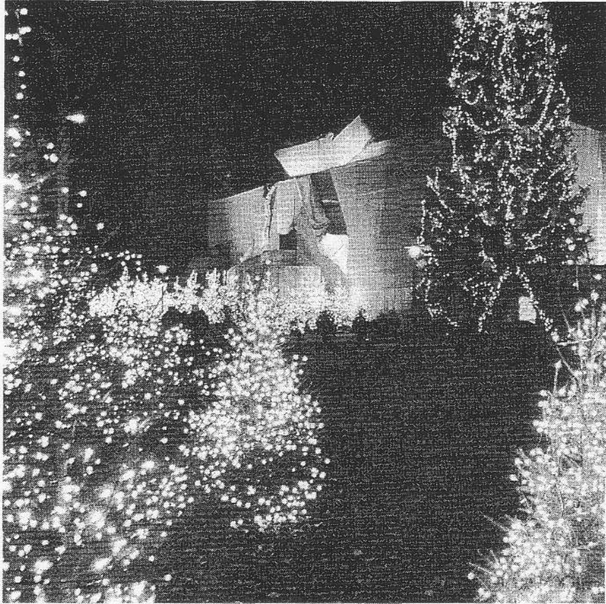
Das «Lake Side» als grösstes Weihnachtspäckli der Schweiz.