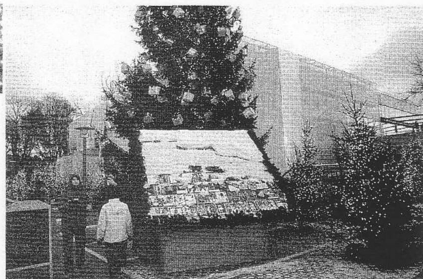
Das Knusperhäuschen der Witiker-Schulkinder.